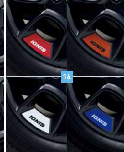
14 | KERÉKMATRICA

Piros Cikkszám: 99236-62R00-ZNB Ezüst Cikkszám: 990E0-61M75-CAP Fehér Cikkszám: 99236-62R00-26U Fekete Cikkszám: 990E0-61M78-CAP