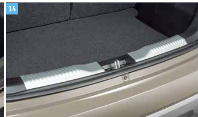
14 | CSOMAGTÉR ÉLVÉDŐ Szálcsiszolt alumínium dizájn, hőre lágyuló műanyagból, védi a rakodóperem belsejét a karcolásoktól ki- és berakodás közben. Cikkszám: 990E0-62R52-000