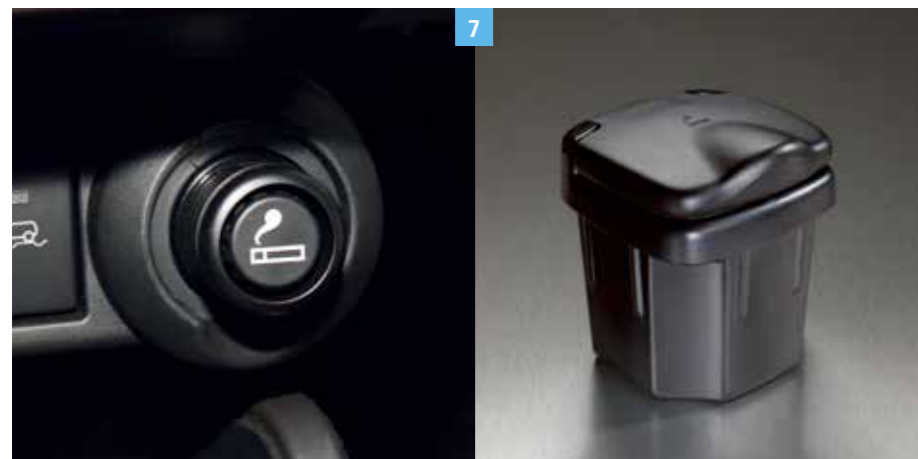
7 | DOHÁNYZÓCSOMAG Szivargyújtókészlettel (Cikkszám: 99KIT-68L00-LIG) és hamutartóval. (Cikkszám: 89810-86G10-5PK) Cikkszám: 990E0-61M00-LIG