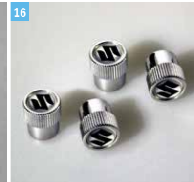
16 | SZELEPSAPKASZETT (S-LOGÓVAL)