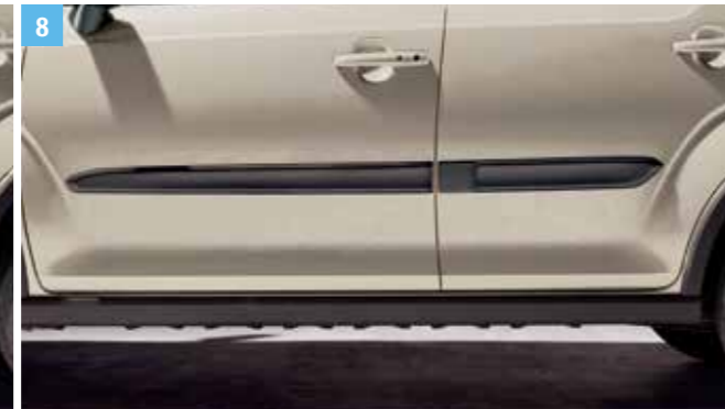
8 | OLDALSÓ DÍSZLÉC, KICSI

Fekete/ezüst, jobb és bal oldali részből álló szett. Cikkszám: 990E0-62R07-000