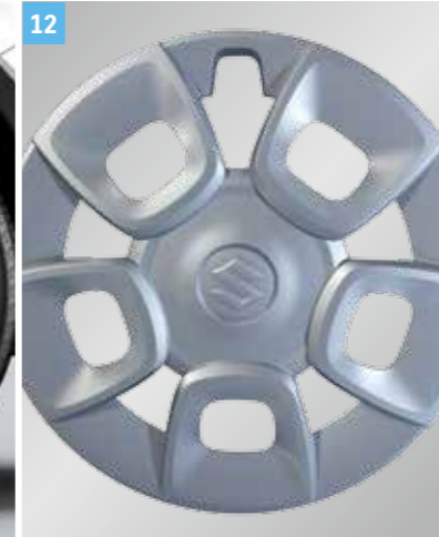
12 | 15 COLOS, TELJES MÉRETŰ DÍSZTÁRCSA

5Jx16", 175/60R16 méretű gumihoz, Suzuki logós középkipakkal, megfelel az ENSZ-ÉGB 124. számú előírásának és a JWL előírásoknak. Cikkszám: 43210-62RB0-000