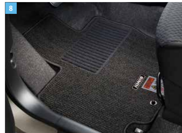
8 | PADLÓSZŐNYEG, HAGYOMÁNYOS 1 6 mm-es fekete szőnyeg 4 mm-es szürke, bordázott betéttel és műselyem emblémával, 4 db-os szett, kézi és automata sebességváltós modellhez. Cikkszám: 75901-62RC2-000 Balkormányos Cikkszám: 75901-62R51-000 Jobbkormányos