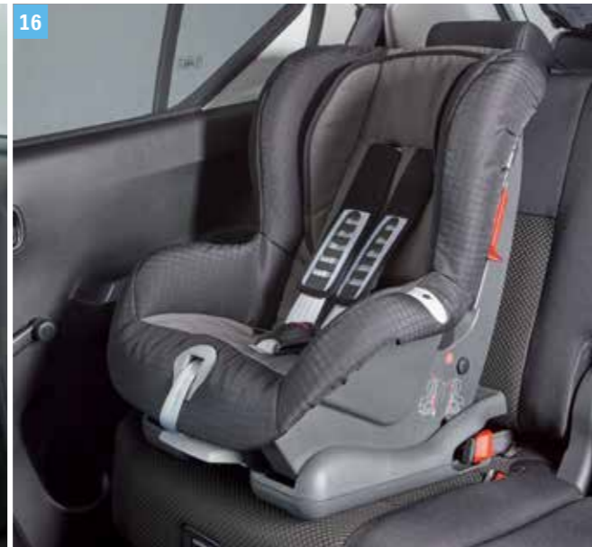
16 | „DUO PLUS” GYERMEKÜLÉS

1-es csoportbesorolású gyermekülés, 9–18 kg-os gyermekek számára, vagy kb. 9 hónaptól 4 éves korig. Az ülés megfelel az ENSZ-EGB 44. számú előírása 04. számú módosításának hatályos változata alapján végzett teszteken. Rögzítés módja: ISOFIX kapcsolódási pontokon, optimális védelem az oldalirányú ütközésekkel szemben, egyedi Forward Tilt Control, egy kézzel állítható álló helyzetből döntött és alvási pozícióba. Ötpontos biztonságiöv-rendszer, egyetlen heveder meghúzásával állítható a feszsége, a vállpárnák csökkentik a gyermek nyakára/fejére ható erőket. A kényelmes anyagú huzat levehető és mosható. ISOFIX rendszer nélkül az autó saját hárompontos biztonsági övével is rögzíthető.