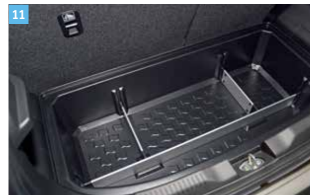
11 | CSOMAGTÉR RENDSZEREZŐ, 2WD 2 Pótkerékkel együtt nem használható. Cikkszám: 990E0-62R21-001