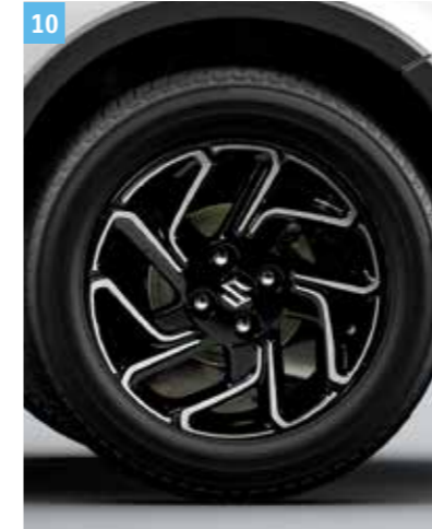
10 | „JUNO” ALUMÍNIUMFELNI, FEKETE, POLÍROZOTT

5Jx16", 175/60R16 méretű gumihoz, Suzuki logós középkipakkal, megfelel az ENSZ-ÉGB 124. számú előírásának és a JWL előírásoknak. Cikkszám: 43210-62RA0-000