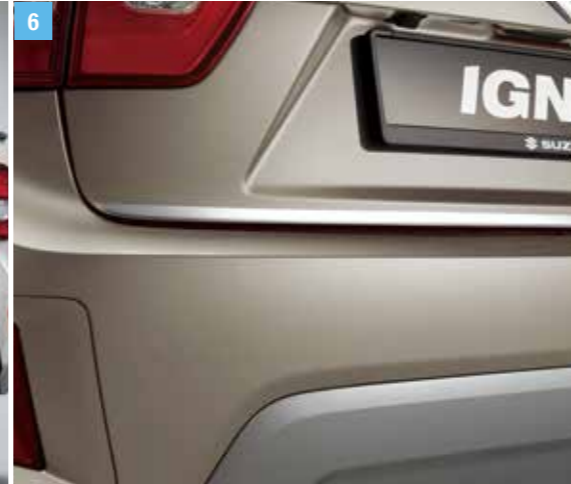
6 | CSOMAGTÉRAJTÓ ÉL, „CHROME”