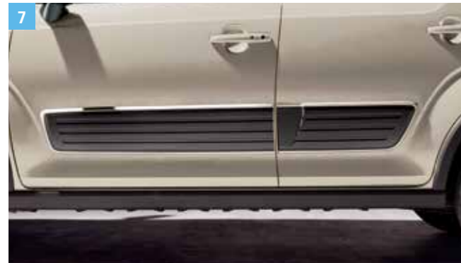
7 | OLDALSÓ DÍSZLÉC, NAGY

Fekete/ezüst, jobb és bal oldali részből álló szett. Cikkszám: 990E0-62R07-000