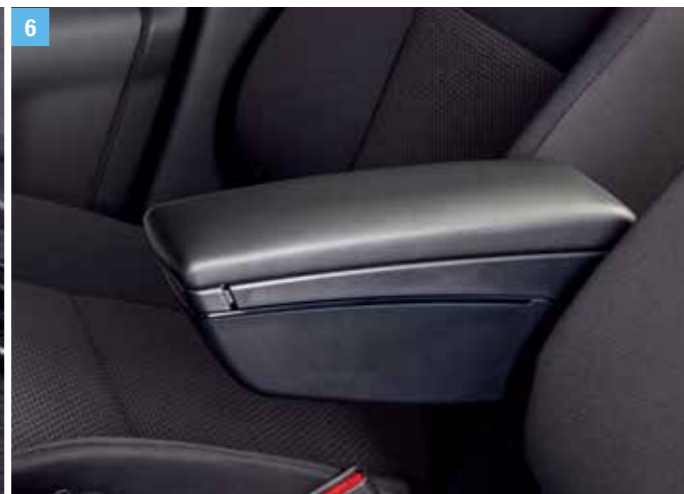
6 | KÖZÉPSŐ KARTÁMASZ A kényelem fokozására, tárolórecesszel, magassága és hossza állítható, fekete. Cikkszám: 990E0-62R35-000