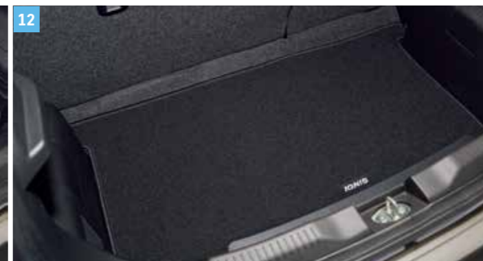
12 | „ECO” CSOMAGTÉRSZŐNYEG, 2WD Csúsztatható hátsó ülésrel felszerelt modellekhez. Cikkszám: 990E0-62R40-001 Fix hátsó ülésrel felszerelt modellekhez. Cikkszám: 990E0-62R40-003