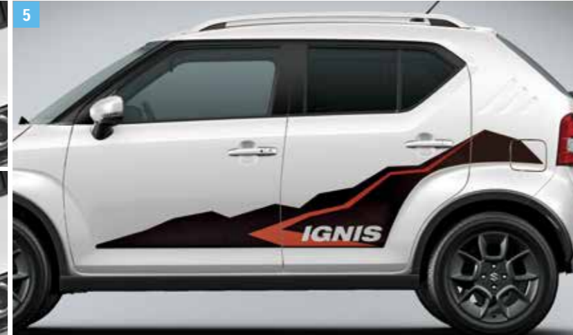
5 | DEKORFELIRAT, „MOUNTAIN”

Fekete Cikkszám: 99230-73S00-001 Szürke Cikkszám: 99230-73S00-002