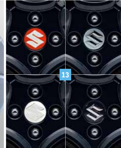
13 | KÖZÉPKUPAK

SUZUKI logóval, 4 db-os szett. Az alábbi színekben elérhető: