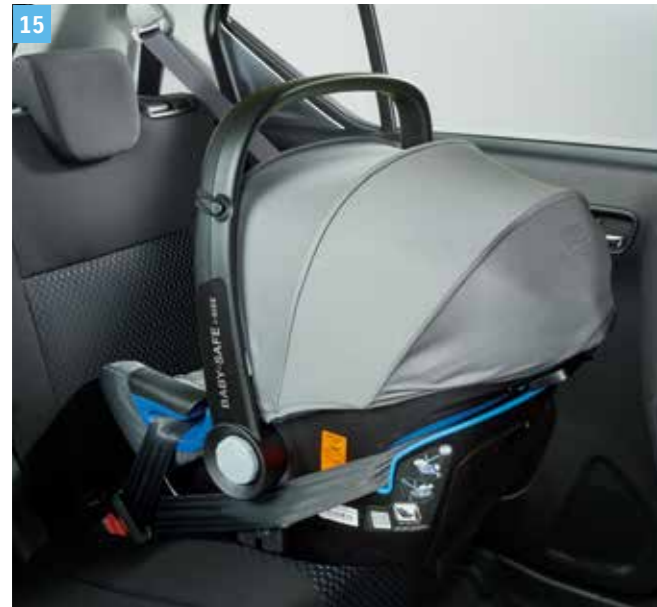
15 | „BABY SAFE I-SIZE” CSECSEMŐHORDOZÓ

A Baby-Safe i-Size csecsemőhordozó megfelel az autós ülésekre vonatkozó, új ENSZ-EGB 129. számú előírásnak. A hordozó biztonságot és kényelmet nyújt újszülött kortól 15 hónapos korig, mivel egészen 83 cm testmagasságig hozzáigazítható a növekvő gyermek testméretéhez.