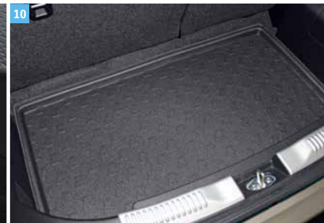
10 | CSOMAGTÉRI TÁLCA 4WD, csúsztatható hátsó ülésrel felszerelt modellhez. Cikkszám: 990E0-62R15-000 2WD és 4WD, fix hátsó ülésrel felszerelt modellhez. Cikkszám: 990E0-62R15-001 2WD, csúsztatható hátsó ülésrel felszerelt modellhez. Cikkszám: 990E0-62R15-002