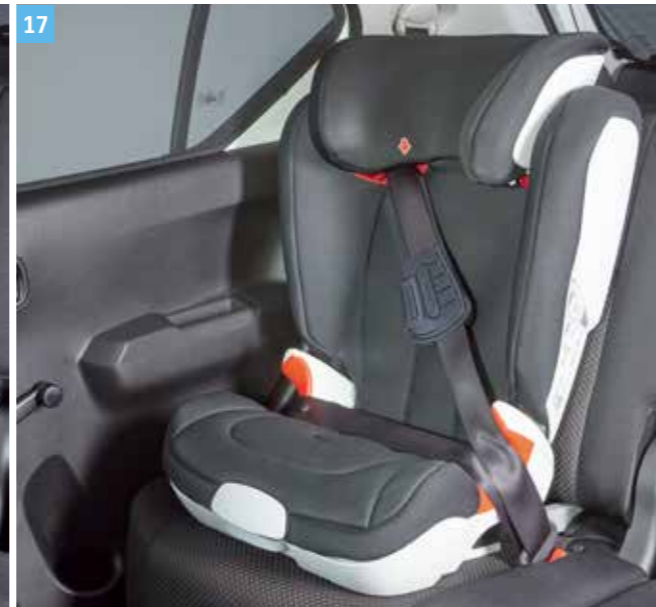
17 | „KIDFIX XP” GYERMEKÜLÉS

Az új KIDFIX XP gyermeküléssel (2-es és 3-as csoport) a szülőknek nagyobb gyermekük (kb. 15–36 kg) biztonságáért és kényelméért sem kell aggódnuk. Az innovatív, magas háttámlájú XP-PAD ülésmagasító megnövelt védelmet nyújt frontális ütközés esetén. Az ülés megfelel az ENSZ-EGB 44. számú előírása 04. számú módosításának hatályos változata alapján végzett teszteken. A gépkocsiba ISOFIX rögzítővel rögzíthető ülés optimális védelmet nyújt az oldalirányú ütközésekkel szemben. A SecureGuard (szabadalmaztatás alatt) gondoskodik a biztonsági öv medencén átmenő részének optimális elhelyezkedéséről. Puhán párnázott, mély oldalszárnyai biztonságosan közrefogják a növekvő gyermek fejét és nyakát. 4-től 12 éves korig ajánlott.