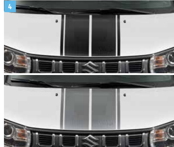
4 | MOTORHÁZTETŐ DEKORÁCIÓ

Fekete Cikkszám: 99230-73S00-001 Szürke Cikkszám: 99230-73S00-002