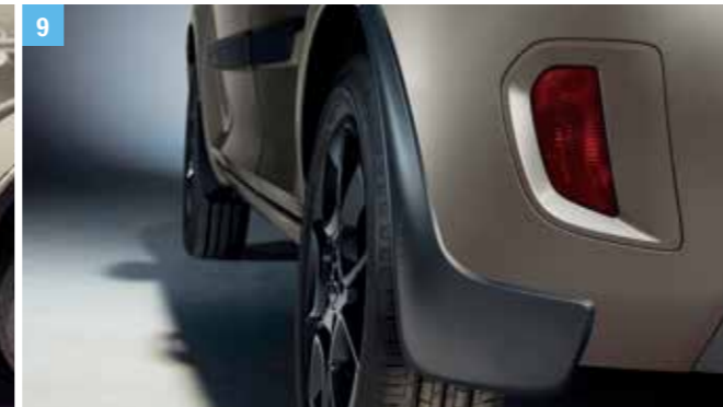
9 | SÁRFOGÓ, MEREV 1

Fekete, jobb és bal oldali részből álló szett. Cikkszám: 990E0-62R08-000