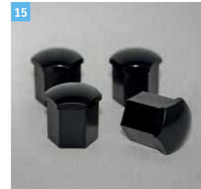
15 | KERÉKANYÁRA VALÓ KUPAK

Piros Cikkszám: 990E0-990EJ-WA1 Narancs Cikkszám: 990E0-990EJ-WA2 Fehér Cikkszám: 990E0-990EJ-WA4 Tengerészkek Cikkszám: 9923A-62R00-005