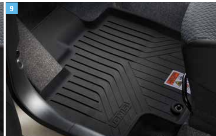
9 | PADLÓSZŐNYEG, PEREMES, BALKORMÁNYOS MODELLHEZ 1 Minden éle emelt a lábtér könnyebb tisztán tartása érdekében, 4 db-os szett, balkormányos, kézi és automata sebességváltós modellhez. (Anyaga: 100% TPS) Cikkszám: 75901-73SG0-000