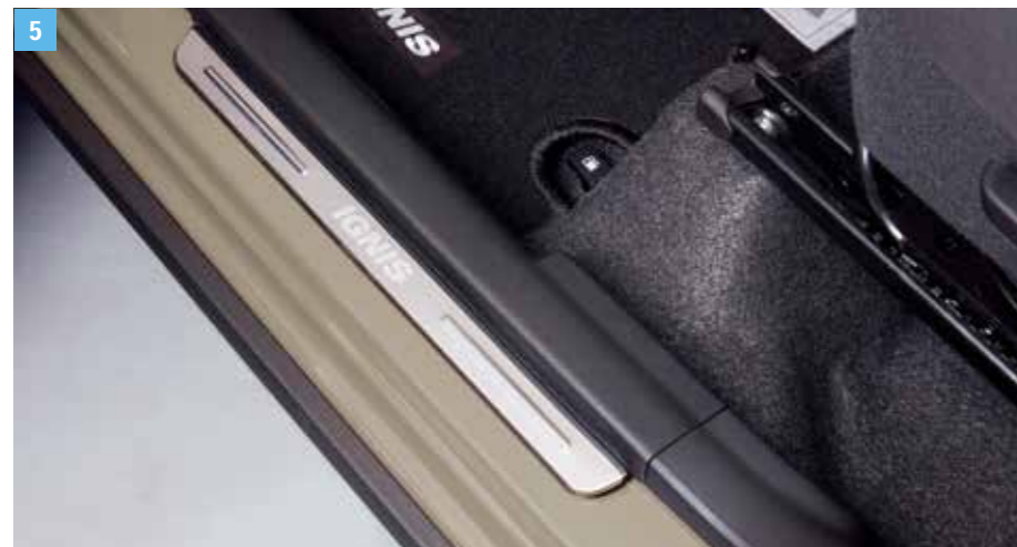
5 | KÜSZÖBDEKORÁCIÓ Rozsdamentes acél, IGNIS logóval, 4 db-os szett. Cikkszám: 990E0-62R20-003