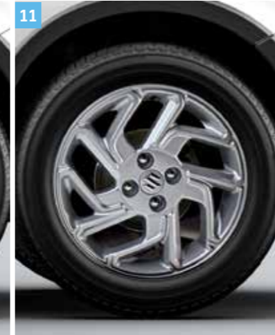
11 | „JUNO” ALUMÍNIUMFELNI, EZÜST

5Jx16", 175/60R16 méretű gumihoz, Suzuki logós középkipakkal, megfelel az ENSZ-ÉGB 124. számú előírásának és a JWL előírásoknak. Cikkszám: 43210-62RA0-000